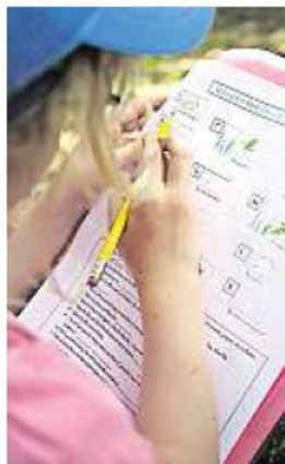
Une expérience enrichissante pour les enfants.

botanique, économie, histoire, contes et légendes, hydrologie, astronomie, cuisine sauvage, l'accompagnateur doit pouvoir