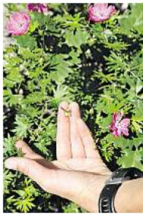
En chemin, les promeneurs découvrent des géraniums sauvages.

botanique, économie, histoire, contes et légendes, hydrologie, astronomie, cuisine sauvage, l'accompagnateur doit pouvoir